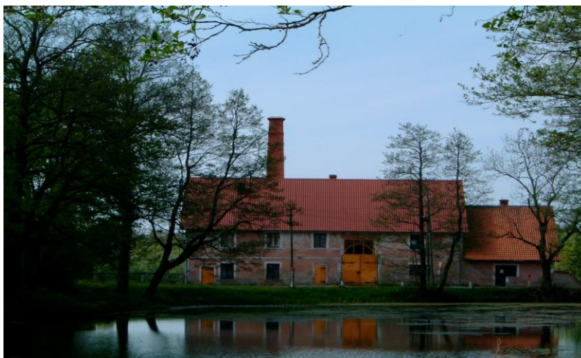
4.att. Strazdes muižas komplekss „Spirta dedzinātava”