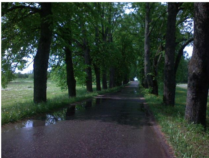
3.att. Strazdes muižas liepu aleja