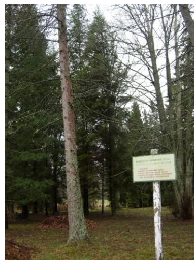
1.att. Robežnieku dendroloģiskais parks

Strazdes muižas kompleksa parks ir vietējas nozīmes dabas piemineklis. Strazdes pagasta teritorijas plānojumā parku teritorijas izdalītas ar mērķi, lai saglabātu parkus, kuru galvenā izmantošanas funkcija ir vieta iedzīvotāju atpūtai. Vienlaicīgi parks nosaka Strazdes ciema vizuālo ainavu un ir dabas aizsargājamās teritorijas. Strazdes muižas parks 6,7 ha platībā un liepu aleja stādīti ap 1870.-1880.gadiem.Strazdes parku divās daļās daļa dīķis- lapegļu audze un parks. Parku ieskauj divas lauces.