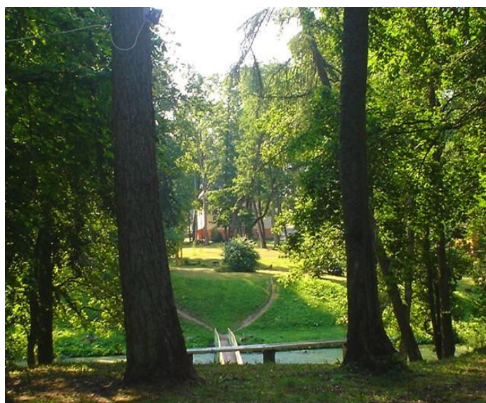
2.att. Strazdes muižas kompleksa parks

Strazdes muižas kompleksa parks ir vietējas nozīmes dabas piemineklis. Strazdes pagasta teritorijas plānojumā parku teritorijas izdalītas ar mērķi, lai saglabātu parkus, kuru galvenā izmantošanas funkcija ir vieta iedzīvotāju atpūtai. Vienlaicīgi parks nosaka Strazdes ciema vizuālo ainavu un ir dabas aizsargājamās teritorijas. Strazdes muižas parks 6,7 ha platībā un liepu aleja stādīti ap 1870.-1880.gadiem.Strazdes parku divās daļās daļa dīķis- lapegļu audze un parks. Parku ieskauj divas lauces.